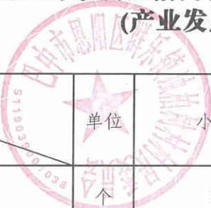
巴中市恩阳区群乐镇独柏树村2024年中央财政衔接推进乡村振兴补助资金 (产业发展资金)项目基本情况表